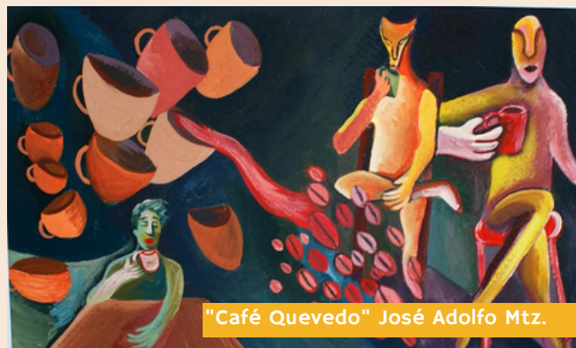
"Café Quevedo" José Adolfo Mtz.

En el mundo hay mas de cien especies del genero Coffea, Café Guetzo se obtiene de los frutos de las plantas de cafeto de la especie Coffea arabica, fundamentalmente de la var. Pluma Hidalgo, var. Bourbon, var. Mango Gype, var. Marsellesa, var. Oro Azteca, y var. Geisha.