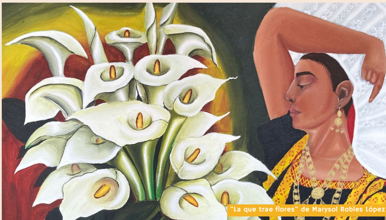
"La que trae flores" de Marysol Robles López