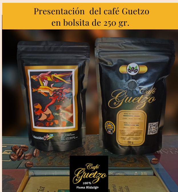
Presentación del café Guetzo en bolsita de 250 gr.

"Penumbbras" es la pieza del maestro Miso que podemos observar en la exposición conjunta "Apostando por el arte" -y comenta- "trato de reflejar el gozo de mis pensamientos, cada quien lo refleja de distinta manera, pero yo traté de plasmarlo como si viviera una cueva y aun así rescatar lo bueno, lo positivo, a veces uno se enfrasca en los problemas y siempre hay que buscar el lado positivo a las cosas y situaciones de la vida diaria".